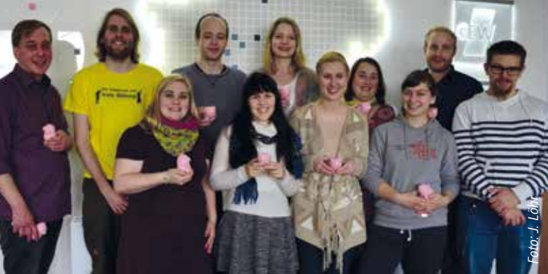
Der Ausschuss junge GEW NRW startet mit 16 Aktiven (fünf davon waren zum Foto-termin nicht dabei) ins Jahr 2016.